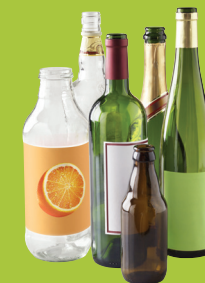
Bouteilles en verre