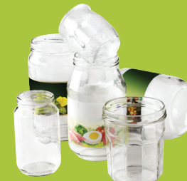
Pots & bocaux en verre