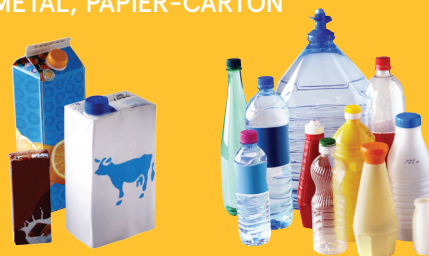
Briques en carton

EMBALLAGES EN PLASTIQUE, MÉTAL, PAPIER-CARTON